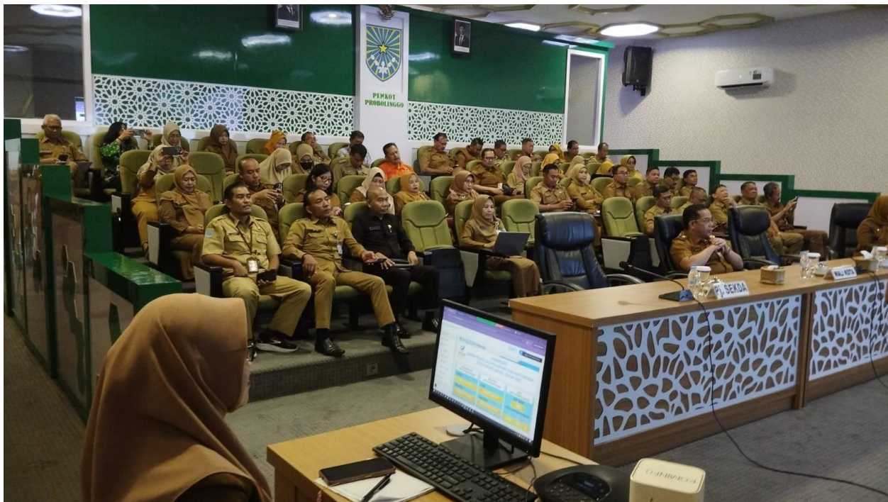
Monitoring Dashboard Pimpinan Pemerintah Kota Probolinggo pada tanggal 24 Desember 2025 Ruang Command Center Kota Probolinggo