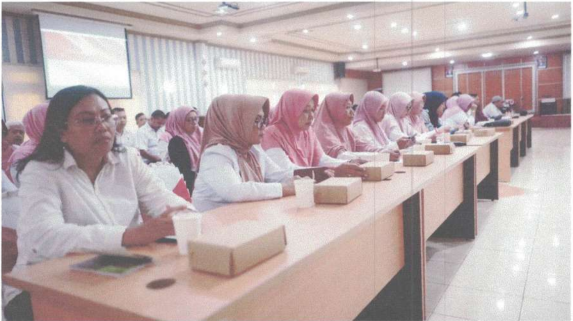
Pelatihan Penyusunan Daftar Informasi Publik serta Uji Konsekuensi untuk Informasi yang Dikecualikan pada tanggal 6 Maret 2024 di Puri Manggala Bhakti