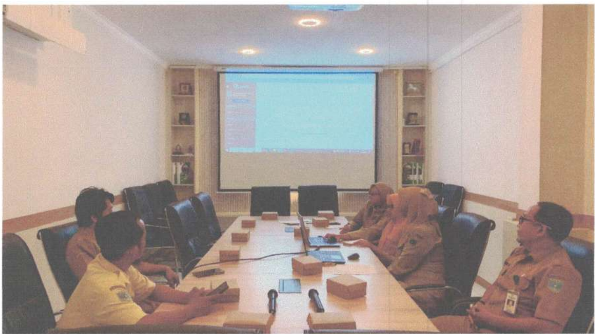
Monev PPID Pelaksana, Media Sosial, Layanan Pengaduan pada tanggal 23 Juli 2024 di BPPKAD Kota Probolinggo